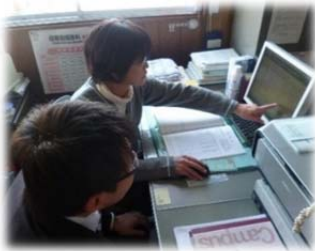
会員様の記帳を支援 (朝日商工会、ネットde記帳)

企業経営をサポートします。 経営一般・経営革新・金融・税務・労務・IT(経営改善普及事業)