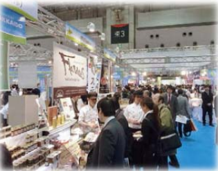
販路開拓支援事業「北の味覚 発見マルシェ」