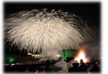
しばれフェスティバル (陸別町)