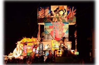
八雲山車行列(八雲町)

まちづくりをサポートします。 イベント・地域のまつり・移住 少子高齢化対策など(地域振興事業)